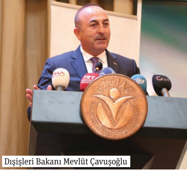
Dışişleri Bakanı Mevlüt Çavuşoğlu