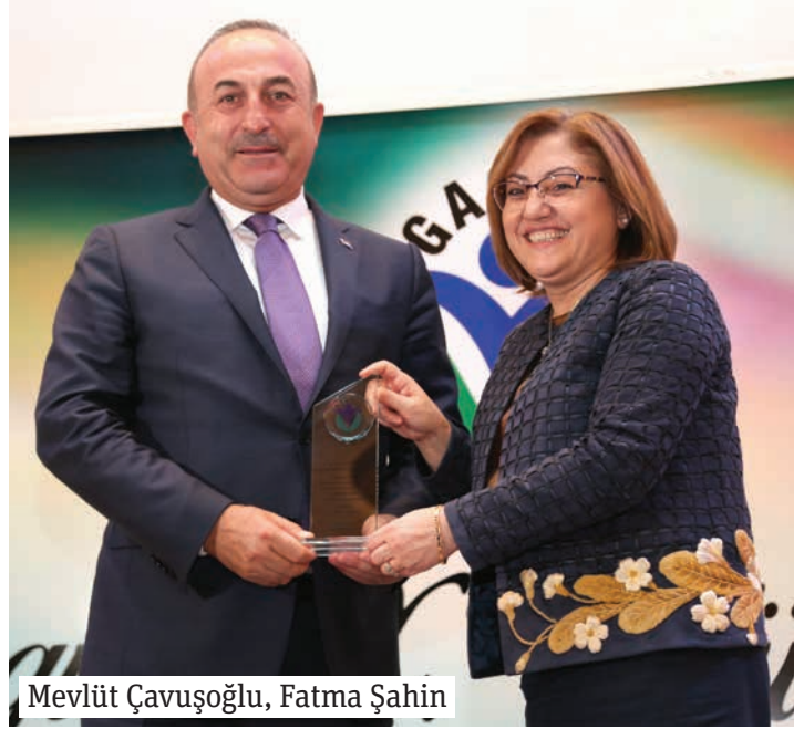
Mevlüt Çavuşoğlu, Fatma Şahin