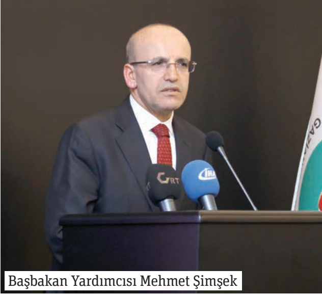
Başbakan Yardımcısı Mehmet Şimşek