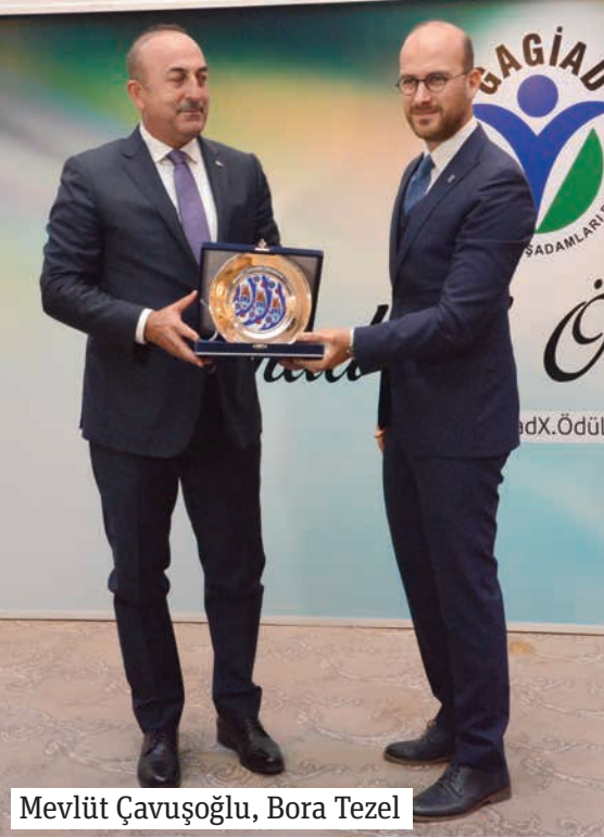
Mevlüt Çavuşoğlu, Bora Tezel